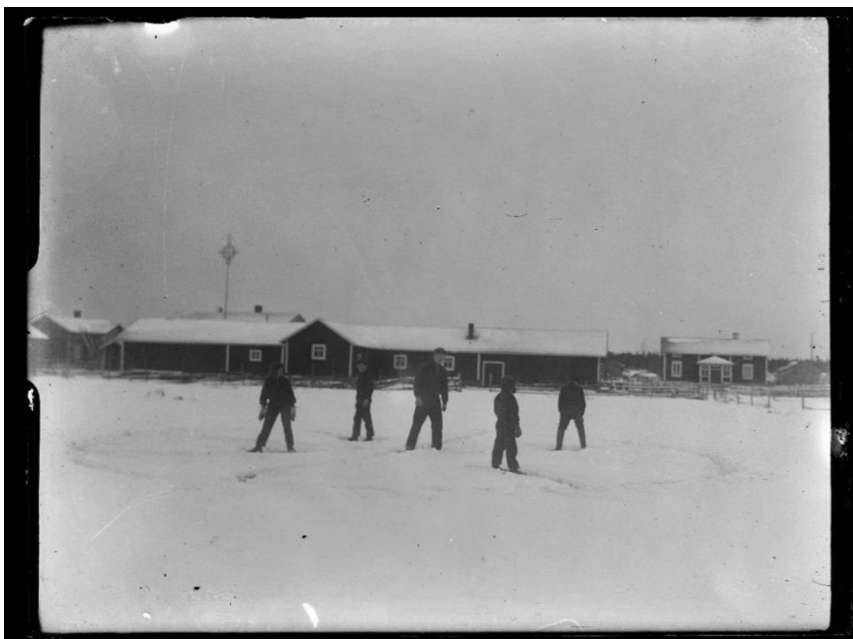
Vargringen 1, Korsnäs år 1937. ( länk till Finna ) Fotograf: Maximilian Stejskal.

Bilder ur samlingen Maximilian Stejskal: Folklig idrott. Folklivsstudier III utgivna genom Folkkultursarkivet. Skrifter utgivna av Svenska litteratursällskapet i Finland. Helsingfors 1954.